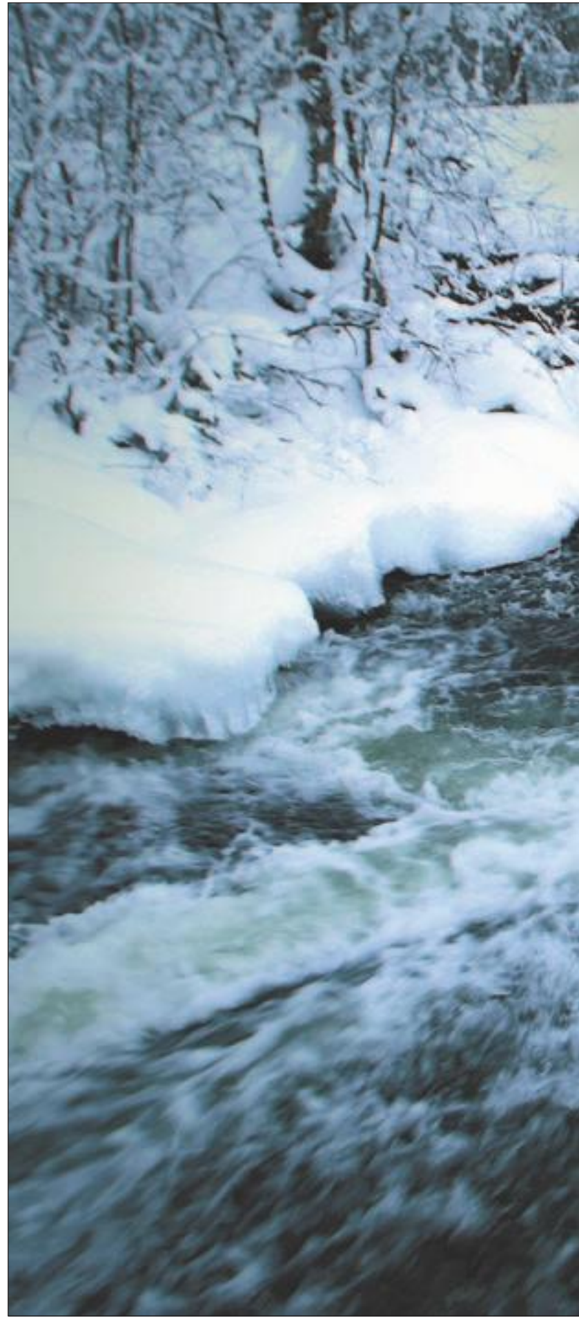
TRUSSEL-VURDERING: – Vi er nødt til å få gjennomført en konkret vurdering av hvil-

Bakgrunnen for SFTs brev er rapporten om at 18 av 59 kontrollerte innsjøer var forurenset av veisalt. Vegdirektoratet har satt i gang et fireåring pro-