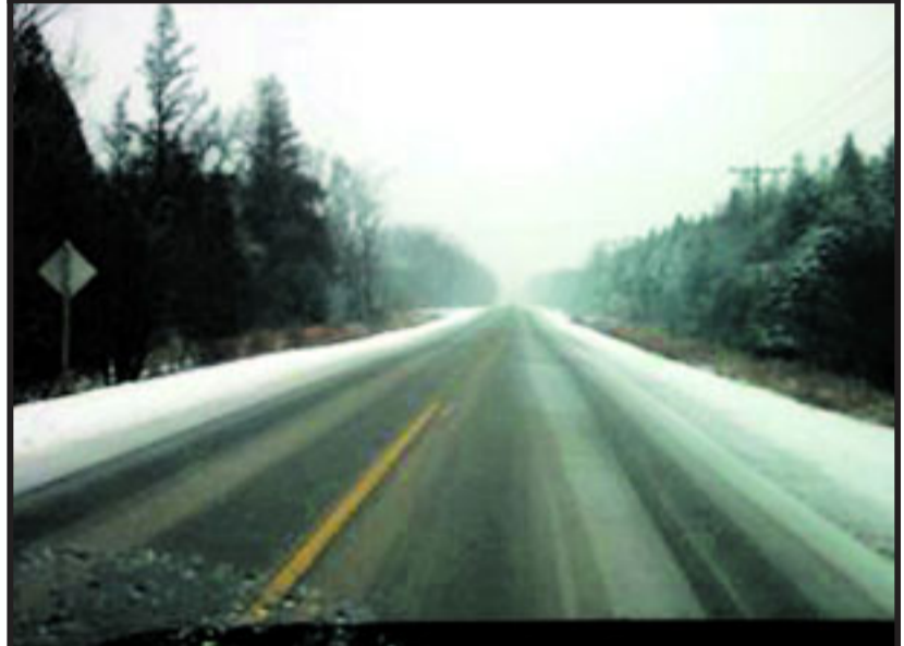
MED SIRUPSBLANDING: ... og slik ser veien ut med sirupsoppfinnelsen.