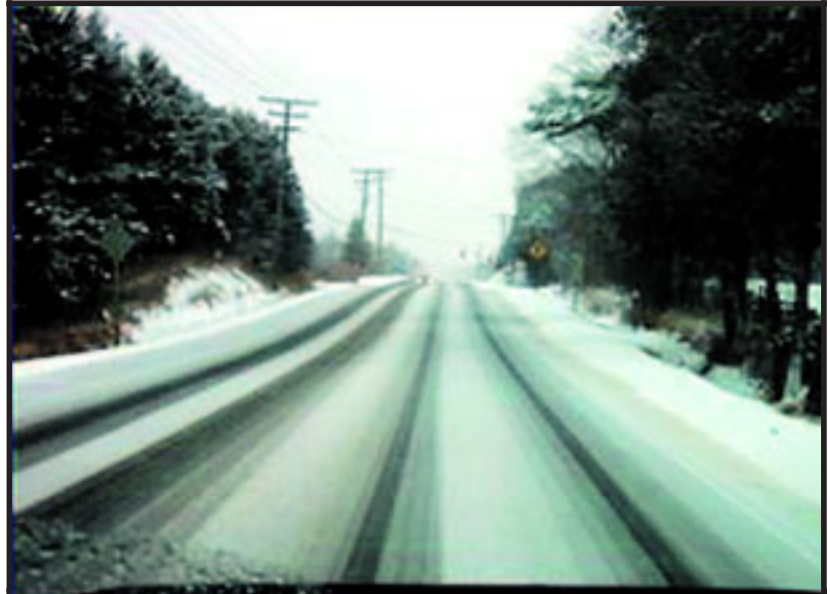
UTEN SIRUPSBLANDING: Slik ser veien ut med tradisjonell behandling.

Blandingen inneholder bare 1/8 så mye klorider som vanlig salt. Og det er kloridene som i hovedsak fører til at salting gir rust på bilene. Dette kan være veivesenets bidrag til mindre rust på bilene. Samtidig binder den svevestøv, noe som kan gi bedre luftkvalitet, sier Mathisen.