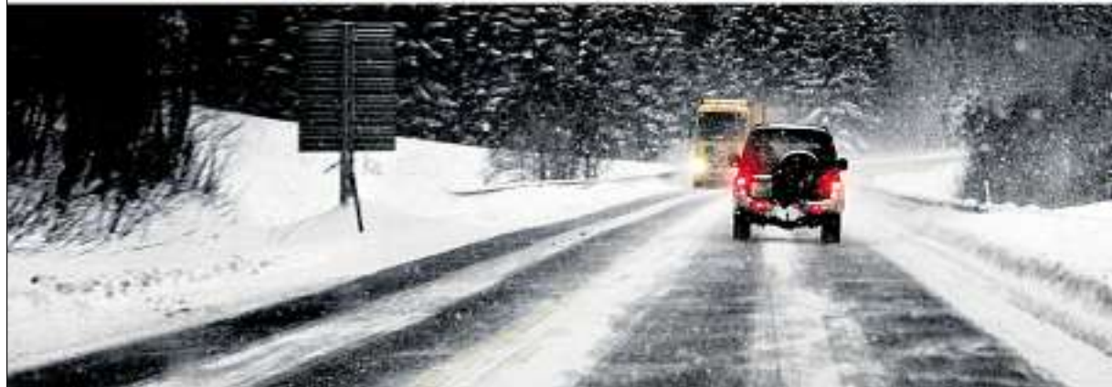
Saltet er en forutsetning for at vi skal kjøre nesten like fort om sommeren som om vinteren, men hva gjør det med trafikksikkerheten? Frontene i krigen om veisaltet er knallharde.

vegvesen lager grunnlaget for vedlikeholdet, men arbeidet er privatisert og konkurranseutsatt. Entreprenørene velger de billigste løsningene.